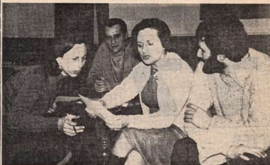
Le comité au travail.

“La randonnée hérimoncourtoise” 27-1-77 dernière née des associations de la cité