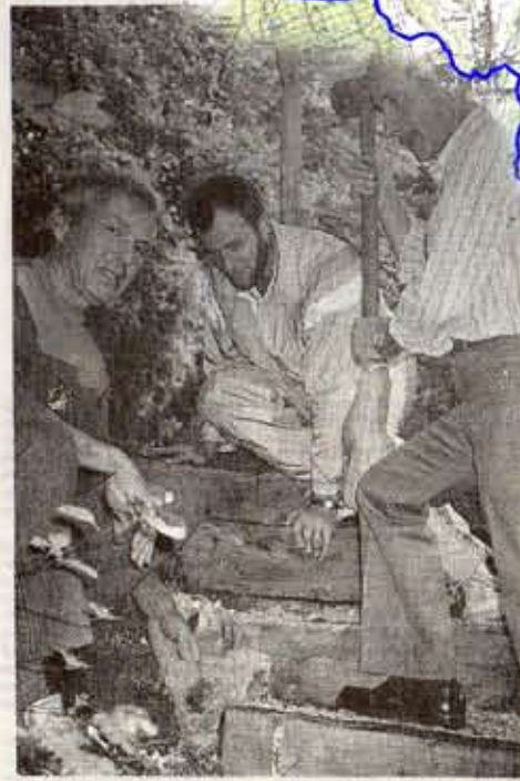
Ils ont beaucoup travaillé pour améliorer le balisage!

Ces travaux, qui se sont déroulés grâce à la coordination du centre de Glay avec la