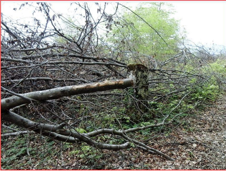
Aucun respect pour...