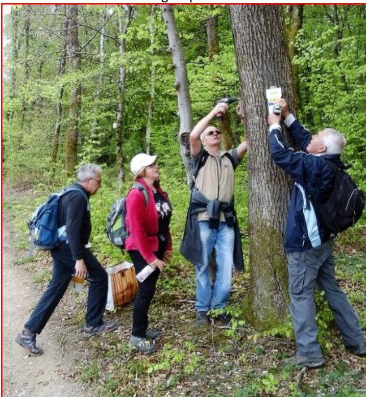
En plein boulot