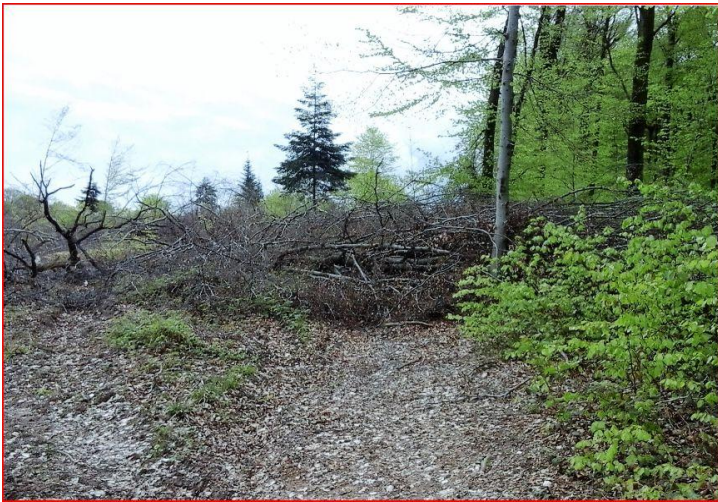
Sentier coupé en plusieurs endroits