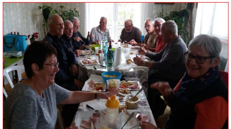
Une belle tablée