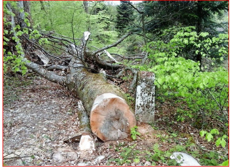
... les Borne en danger !