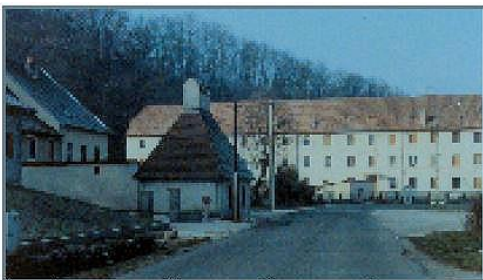
Le saloir rénové et l'ancienne filature transformée en immeuble locatif, de la Chapotte.

2 Rencontrer bientôt le sentier du GR de Pays (balisage : rouge et jaune) qui nous tient compagnie jusqu'au village de Thulay.